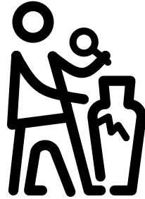
Joonis: Muuseumikülastusi 1000 elaniku kohta 2000–2017